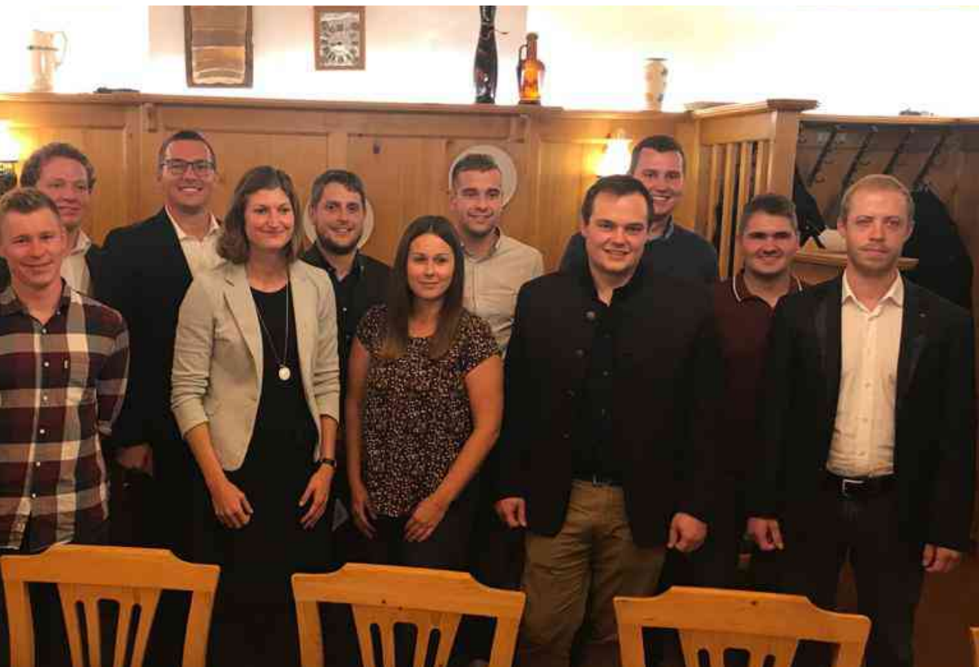
Die gewählten Funktionäre der SPÖ Bad Zell

den Zeit und vielen wichtigen Entscheidungen. Wo kann und soll Gewerbegebiet entstehen? Wie soll der Marktplatz belebt werden? Um die vielen Fragen der Zukunft zu besprechen, wird der Gemeinderat, gemeinsam mit Bürgerinnen und Bürgern, eine Gemeinderatsklausur durchführen. Besonders die Einbindung von Menschen in den verschiedenen Lebenssituationen ist uns wichtig.