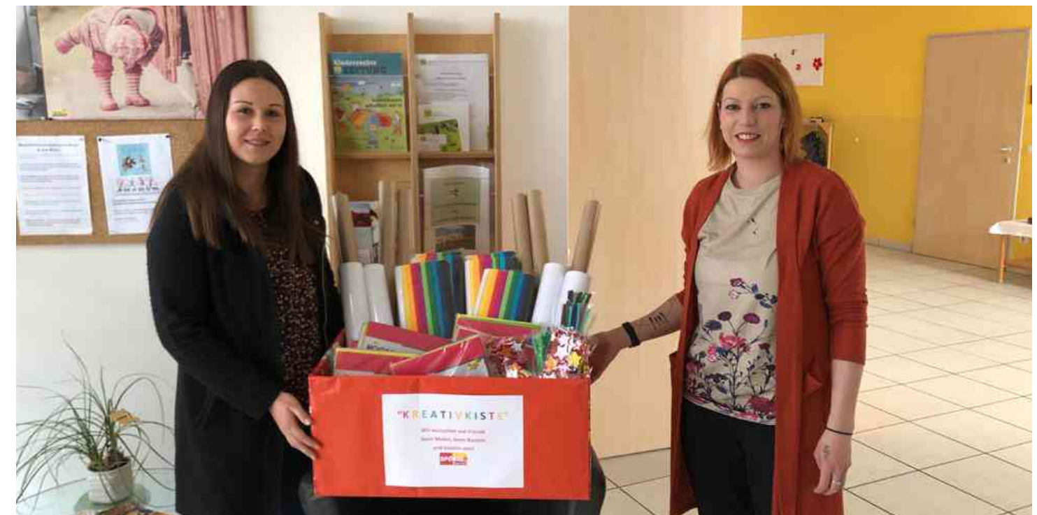
Kreativkiste für die Kleinsten