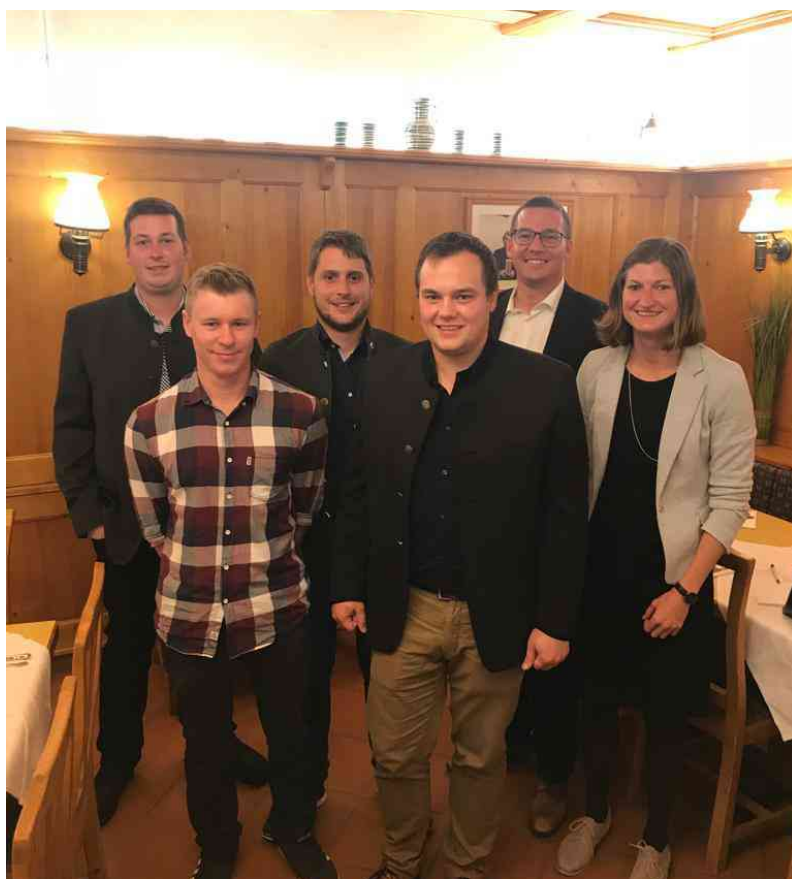
Die sechs SPÖ Gemeinderäte